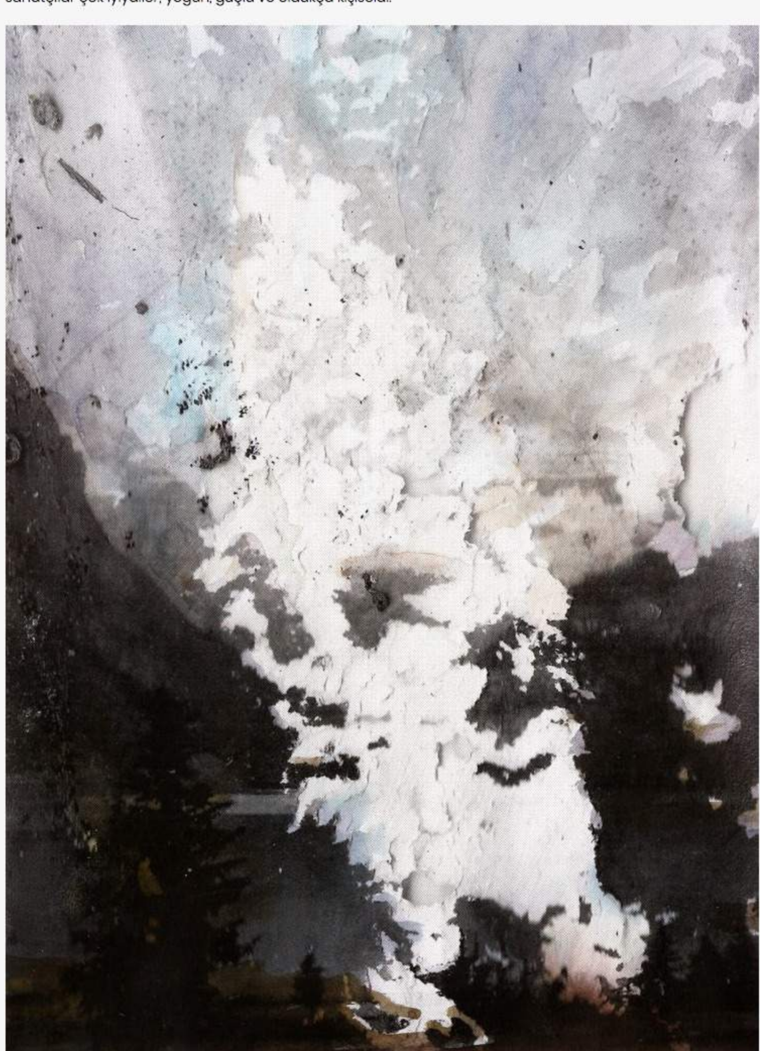
Templato II dessin, 2016

Renge ve sürece ihtiyacım var. Renk, resimde önemli bir faktör. İyi bir renkendirici olmalısınız. Bu benim için çok önemli. David Lynch hakkında konuşuyorduk ve Lars Von Trier'i de çok severim, çünkü renk kullanımı onlar için de çok önemli. Bunu kullanabilmek de oldukça zor. Renk hissedilir ve örneğin Vermeer bu konuda çok iyiydi, Flemenk sanatçılar çok iyiydiler; yoğun, güçlü ve oldukça kişiseldi.