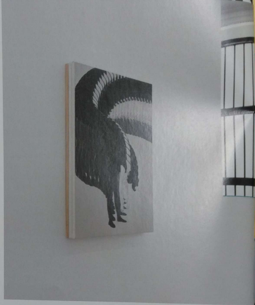
Default (Self) 100x70x7.5 cm, oil on canvas with extra stretchers, 2016

Bu odada, Leyla Gediz'de ta başından beri karşımıza