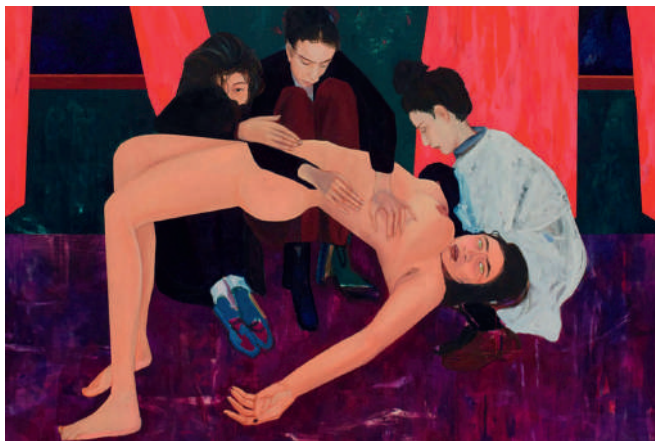
“The Cure” betegnes som et af Apolonias hovedværker.

H un kommer cyklende hen over Montmartres brostensbelagte gader iført en gul dynejakke og med sin hund i cykelkurven. Egentlig skulle vi have mødtes for lidt over en time siden, men så tikkede en besked ind på WhatsApp om,