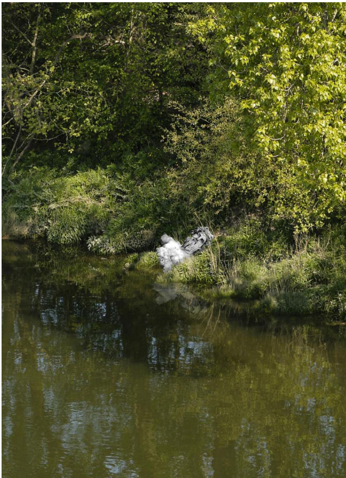
Le Naufrage de Neptune, Ugo Schiavi , Passerelle Schœlcher © Esquisse : Ugo Schiavi