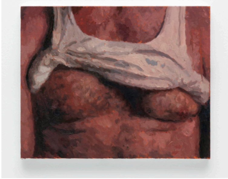
Berke Dođanođlu, Undershirt , 2023, Tuval üzerine yağlı boya, 40x50 cm