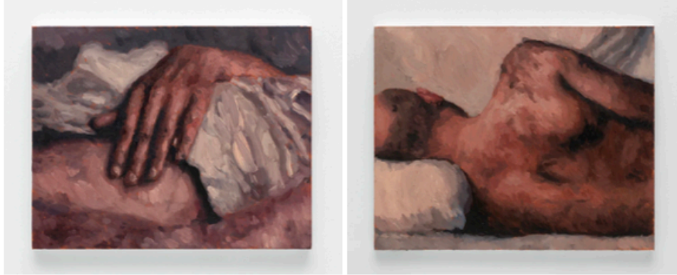
Berke Doğanoglu, Sheets , 2023, Tuval üzerine yağlı boya, 40x50 cm