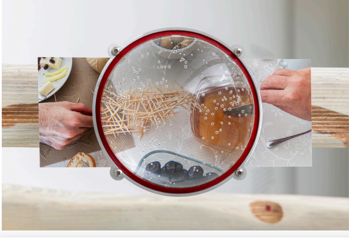
Cem Örgen, Breakfast with Family photos , Yağmur Riski genel sergi görüntüsü

Press Review Art Unlimited, Murat Alat, May 2024