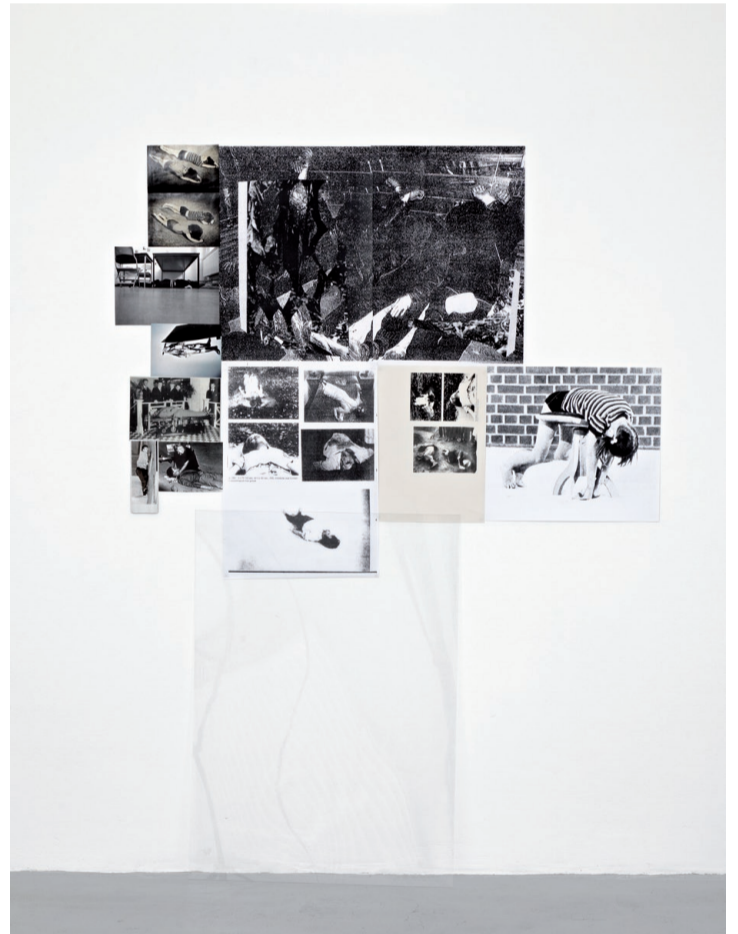
Lying , 2009.