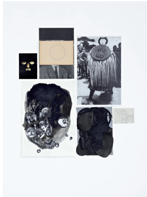
They are not resisting our gaze II , 2009.