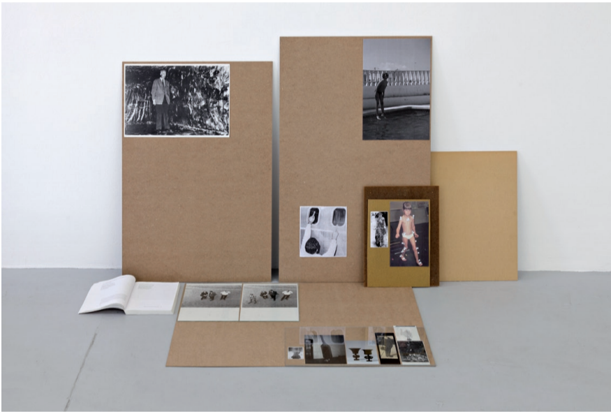
Each movement appears like hesitation , installation view, Circus, Berlin, 2009.