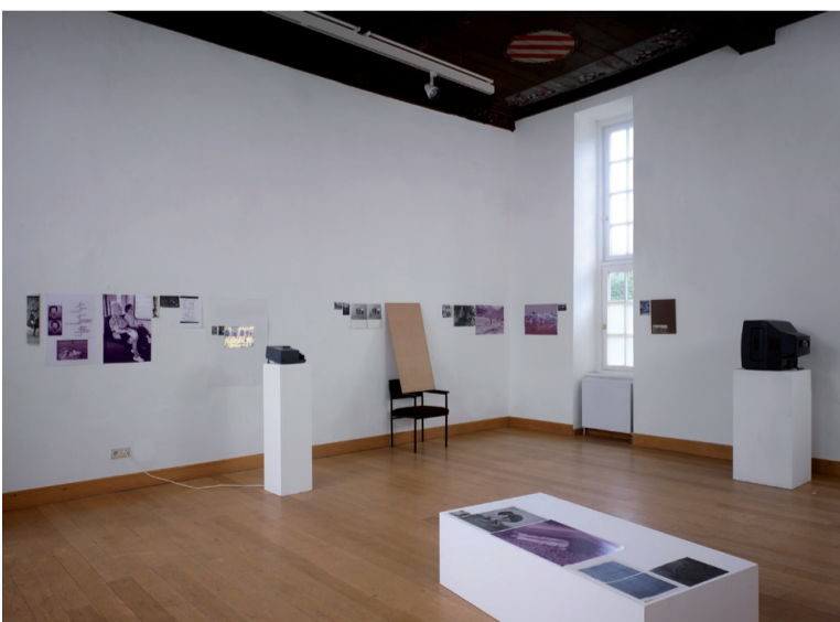
Rolling Horizon , 2008, installation view Schloss Ringenberg, Hamminkeln.