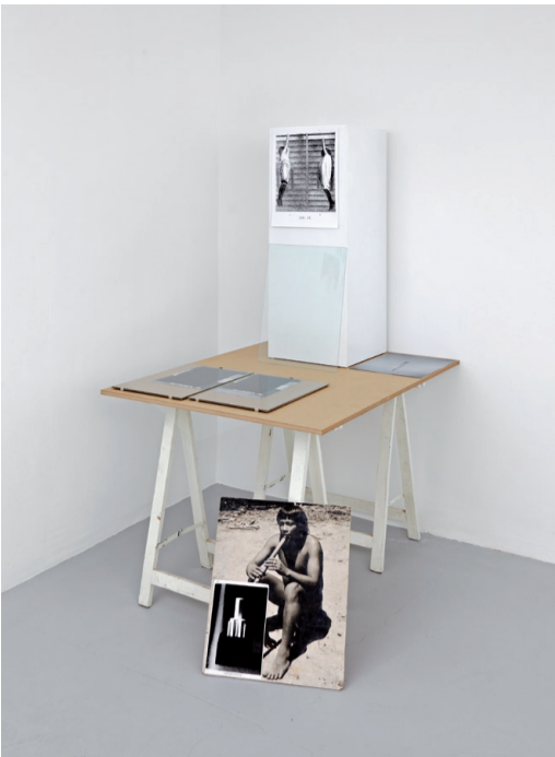
A minor catastrophe , 2009.