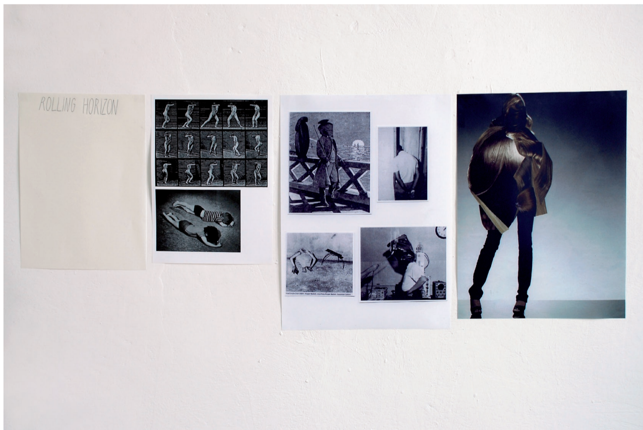
Top – Erstarrte Unruhe (detail) , 2009.