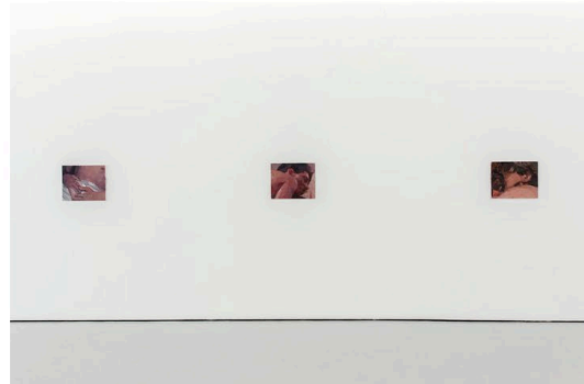
Berke Dođanođlu, Adem, Gün Ağarırken sergi görüntüsü