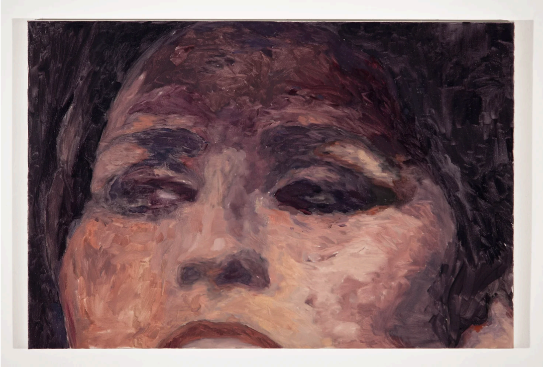
Berke Dođanođlu, Şarkıcı, 2015, 60 x 90 cm, Tuval üzerine yağlıboya

Adem, Gün Ağarırken 'de, göz her bir tuvalde renk lekeleri üzerinde gezinirken, karanlıkta kalana, karanlık olana doğru çekiliyor. Bu karanlıklar kasvetli çukurlar değil, her biri ışık tutulmamış birer boşluk. Bu boşlukların, sanatçının bir beden olmanın mutlu ve dehşetli, haz ve acıyla ilgili, kuvvetli ve kırılğan yanlarına ihtimam göstermeye dair kararını tutan boşluklar oldukları seziliyor. Bir beden olmanın açıklığını korumaya, kollamaya dair bir ihtimam bu. Betimlemeden, tespit etmeden, erişmeye teşebbüs etmeden, bir şeye dönüşeceği âna bakmadan, dönüşümün momentlerini kavramaya çalışmadan, açıklığın kendisine gösterilen bir ihtimam. Sergide yer alan bir resimden diğerine ilerlerken karşılaşılan fragmanlar, ışık tutulmamış karanlık kadar ışıkla görünür olmaya ve bakılabilmeye dair sorular da uyandırıyor. Sıklıkla kamusal alanda politik anlamlarıyla tartışılan “görünmek”, bu resimlerde başka bir içtenlikle kuruluyor. Bakma yönelimleri, bedene bakma eğilimleri, beden fragmanları lehine yeni katmanlar kazanırken bütün ve işlevsel beden aleyhine sarsılıyor. Bir bakıma, bu resimler, aceleci, anlamlandırılan, konumlandırılan ve bir anlatı içinde yer belirleyen bakma alışkanlıklarına sırt dönüyor. Sembolik veya ruhani yüklerinden sıyrılmış, idealize edilmemiş, dünyevi bir beden olmanın açıklığını duyumsamaya çağırıyor.