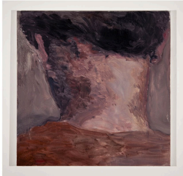
Solda: Berke Dođanođlu, Gecelik , 2015, 75 x 100 cm, Tuval üzerine yađlıboya