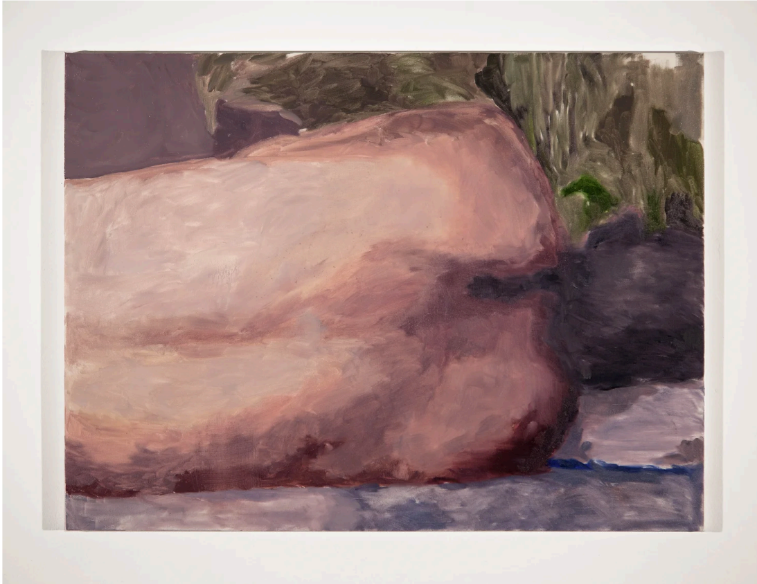
Berke Dođanođlu, Beden , 2015, 75 x 100 cm, Tuval üzerine yağlıboya