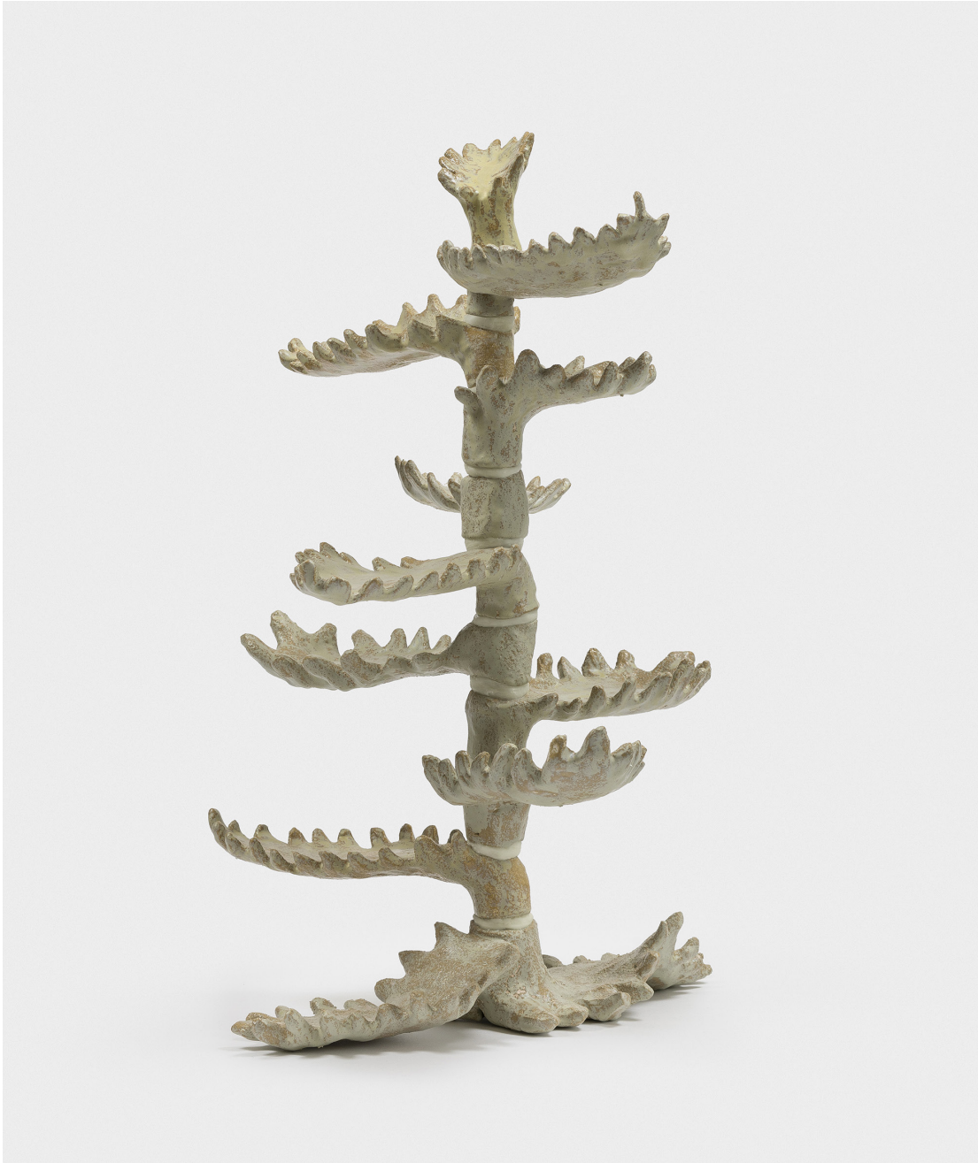
Marion Verboom, Apex n°2, 2020, céramique émaillée, 67 x 46 x 44 cm