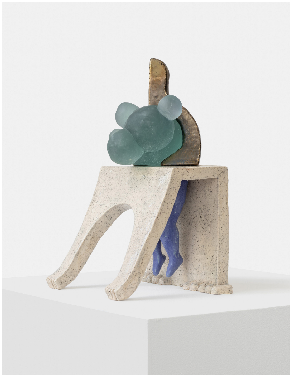
Marion Verboom, Madone 1, 2021, céramique émaillée, cristal, 36 x 22 x 21 cm, courtesy de l'artiste