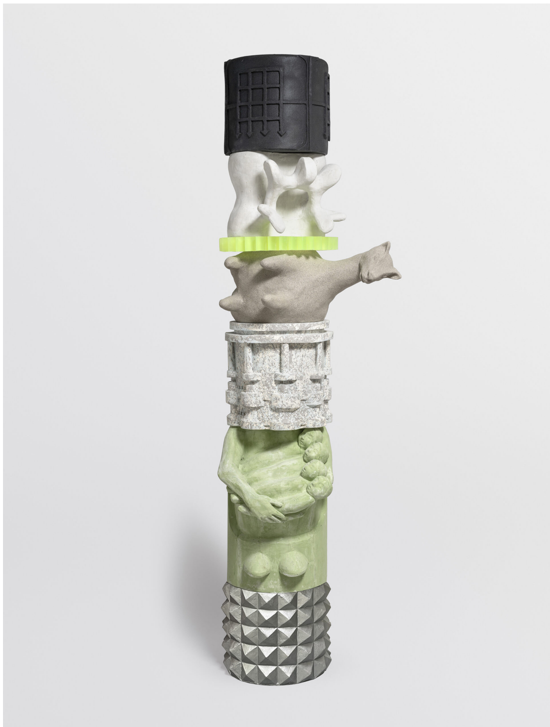
Marion Verboom, Achronie n°30, 2022, plâtre, pigments, peinture, résine, 254.5 x 74 cm, courtesy de l'artiste