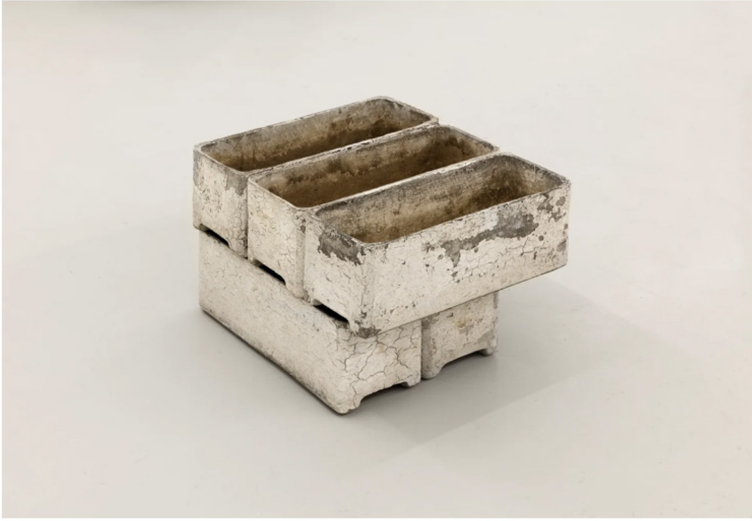
Leyla Gediz, Nesilden Nesile, Çiçek saksıları (çimento) ve kuş yemi (buğday), 40x46x30 cm, 2017

Press Review Unlimited, Muge Buyuktalas, March 2017