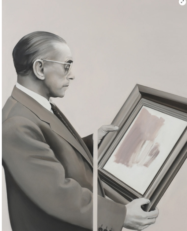
Leyla Gediz, Le Connaisseur, Tuval üzerine yağlıboya, 100x80x4 cm, 2016