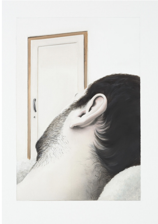
Leyla Gediz, Rip Curl, Tuval üzerine yağlıboya, 50x70x4 cm, 2016