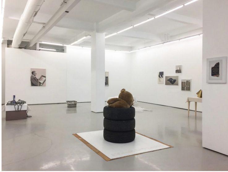
The Pill, Serpilen, Genel sergi görüntüsü, İstanbul