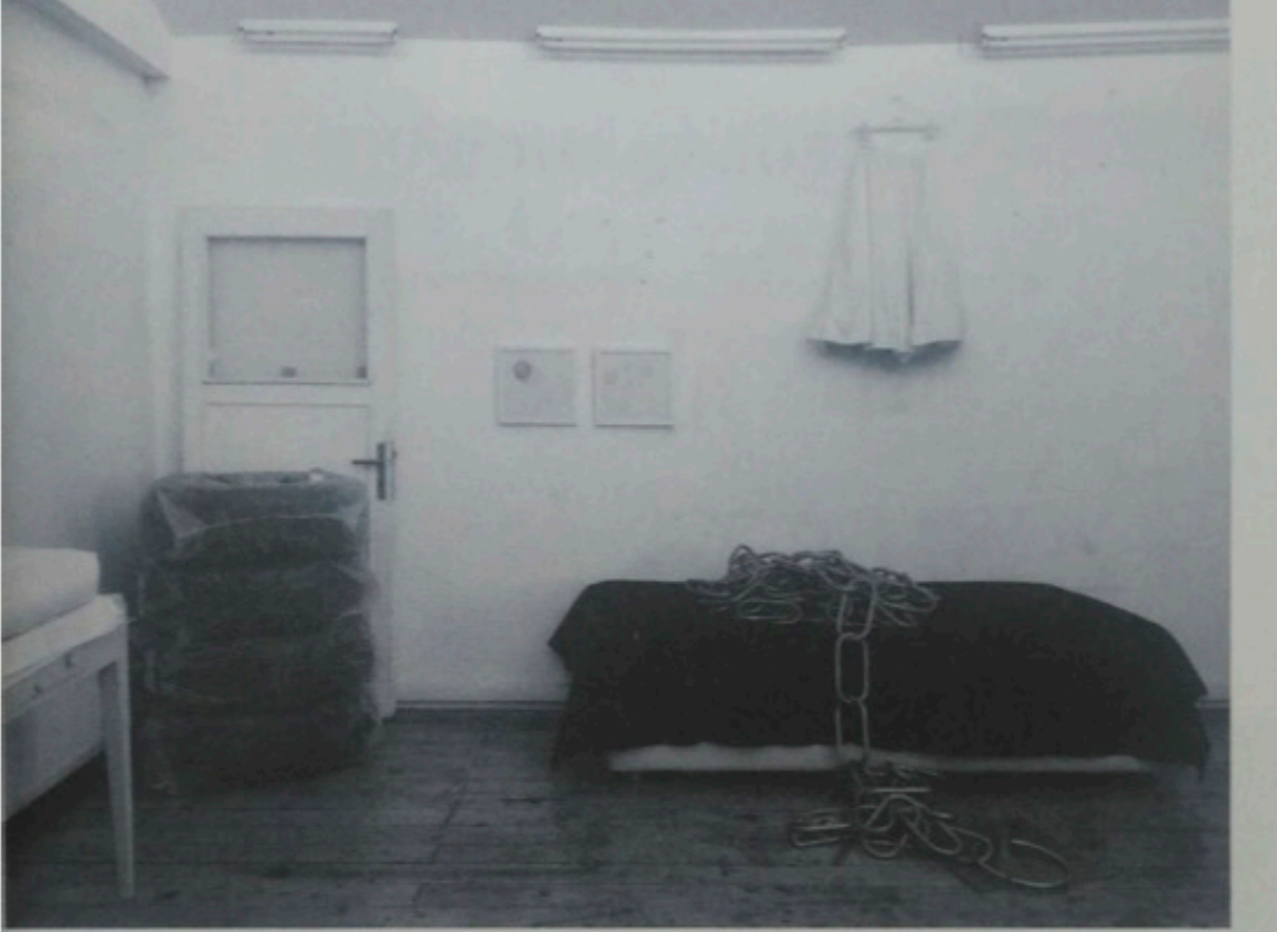
Interface / Arayüz // Hahnemühle Matt Fibre üzeri fotoğraf baskı //104 x 134 cm // 2016

Bu sorunun yanıtını sergiye bırakmak daha doğru olurdu... İzleyiciye bırakmak yani. Yine de şunu söyleyebilirim: bugüne kadar hiç kaynak sıkıntısı çekmedim. Daima elimin altında ve bana anlamlı gelen bir parça eşya, eski bir fotoğraf, bir yazı vb. gibi bulmuşumdur. Başlangıç için tabii! Yoksa kaynak ile konuyu karıştırmamak lazım. "Çerçöp" kelimesini çok seviyorum, çünkü doğru, ama çerçöp, konuya değil kaynağa işaret ediyor. Mamafih verdiği örnekte konuyla kaynağı birbirinden ayırmak da zor! Yine de, diyelim kaynak bir alışveriş fişi, ama rastgele bir alışveriş fişi de değil. Bu, 2016 senesi içinde Nişantaşı'nda bir