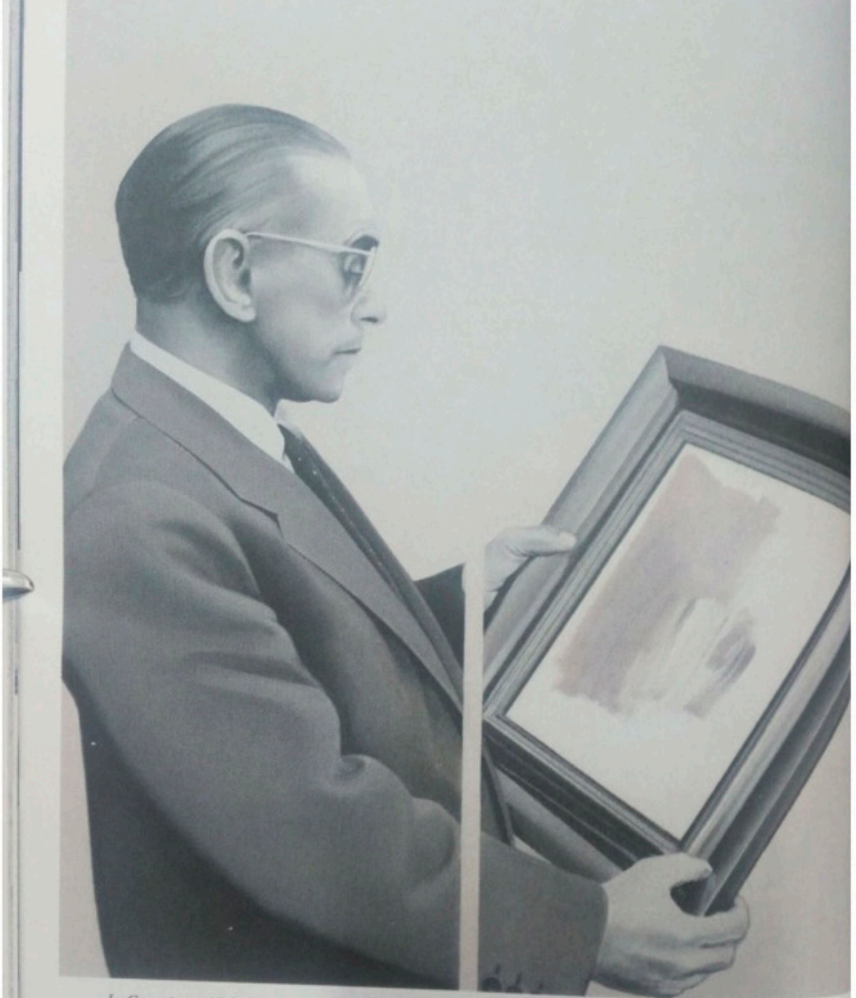
Le Connaisseur / Bilirkiçi 100 x 80 x 4 cm tuval üzeri yağlı boya 2016